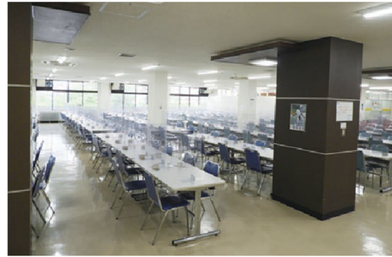
全席にパーティションを設置（食堂）