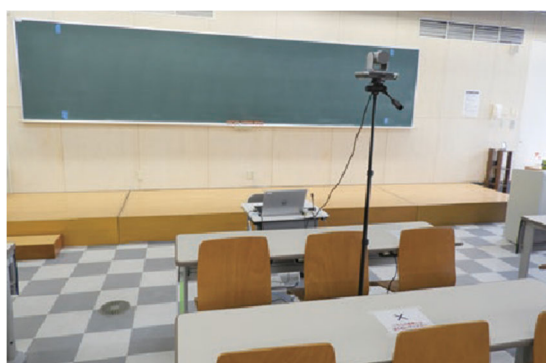
リアルタイム配信カメラの設置（八木山、長町教室）