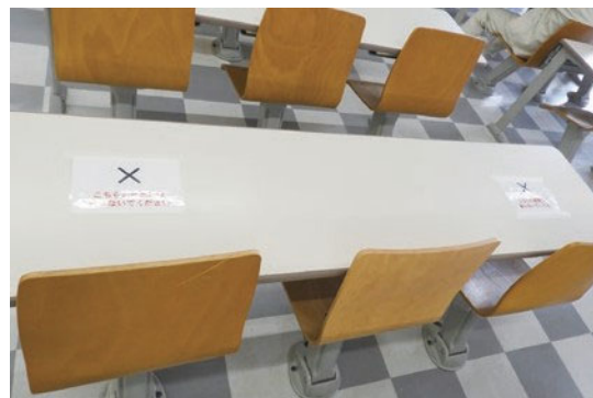
教室座席数を制限（八木山、長町教室）