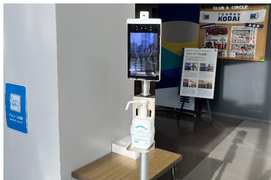
アルコール消毒液、検温計の設置（八木山1号館入口）