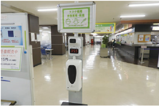
検温消毒一体型機器の設置（食堂入口）