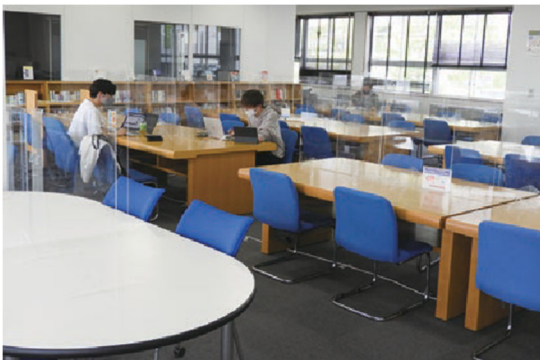
全席にパーティションを設置（図書館）