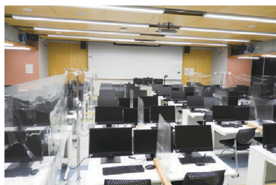
飛沫防止フィルムの設置（八木山9号館1階IT演習室）