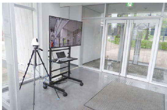
サーモグラフィカメラの設置（八木山1号館入口）