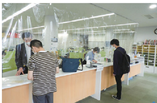
飛沫防止フィルムの設置 （八木山1号館学生サポートオフィス）